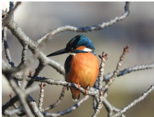
不忍池のカワセミ