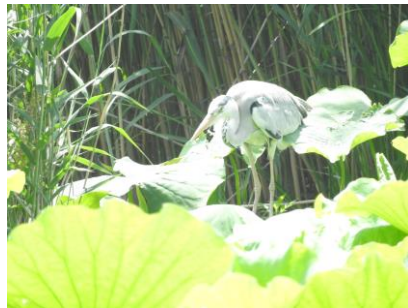
餌を狙うアオサギ