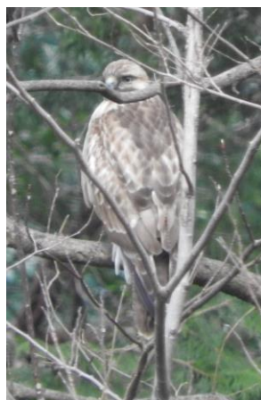
代々木公園で出会った オオタカ