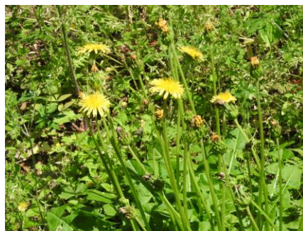
カントウタンポポ