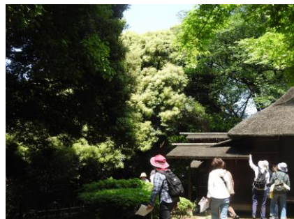
頭上の白いのはスダジイの花