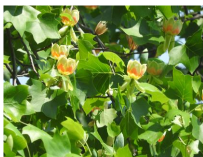
表庭のユリノキの花