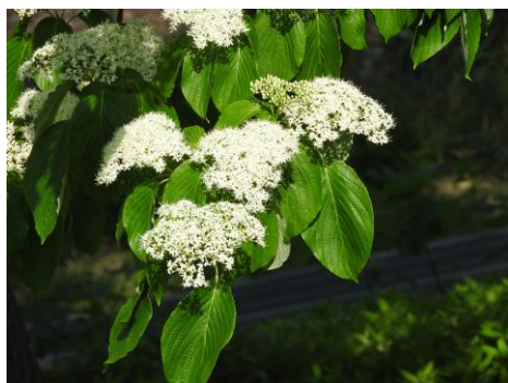
谷中霊園のミズキの花