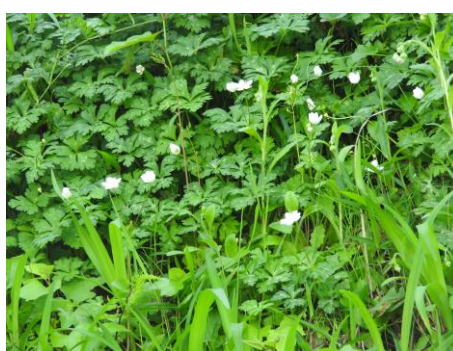
ニリンソウの咲き残り