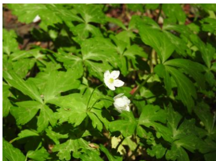
東博裏庭のニリンソウ

谷中霊園のニリンソウも花はほぼおしまい、東博、谷中霊園とも、ミズキの花が咲き誇っていました。