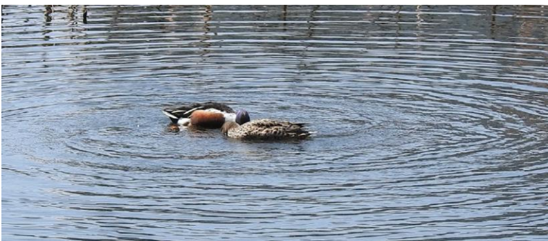
ハシビロガモの採餌行動