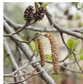
ヤシャブシの雄花