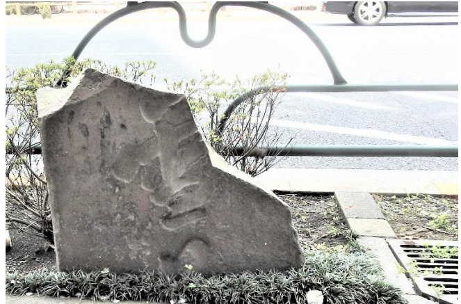
蓑羽 (みのばね) を見せるコサギ 雪見橋の石碑(「雪」の肩が欠け「見」の大半は地中)

しのばず自然観察会 事務局 〒110-0001 台東区谷中3-1-9 小川潔 方 1975年創立 電話 03-3828-8775 URL : http://sinobazu.extrem.ne.jp 郵便振替 00100-8-84609 しのばず自然観察会 年会費 2,000円 ほかに行事参加費