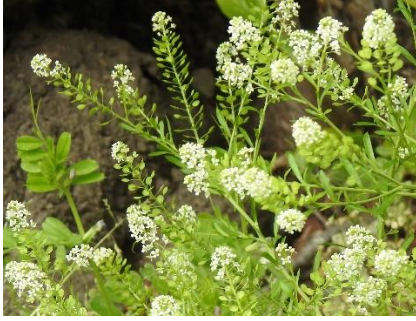
マメゲンバイナヅナ